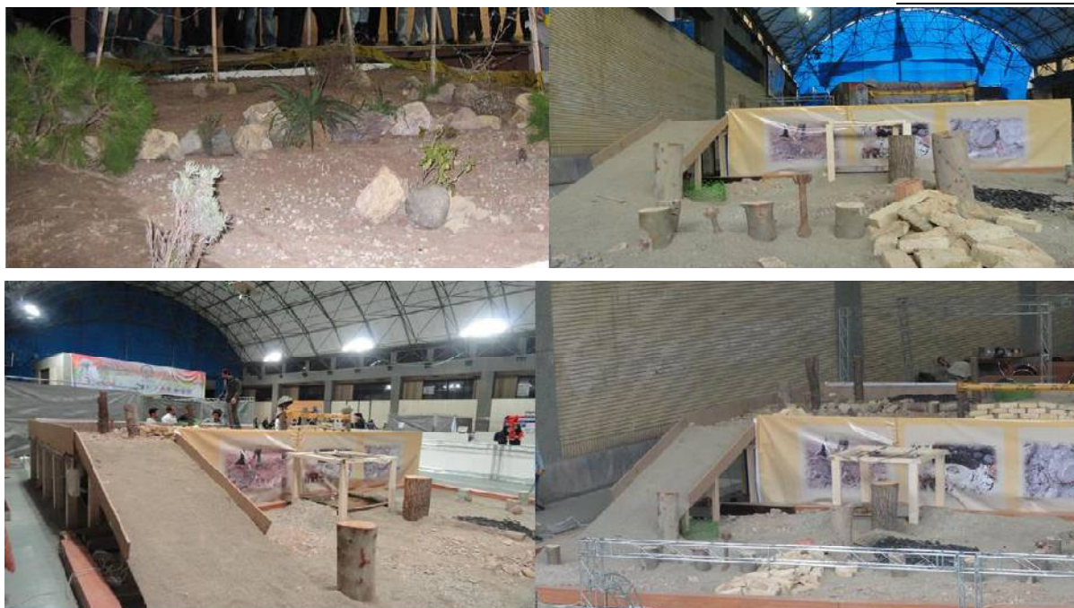
نمایی از زمین مسابقات در سالهای گذشته